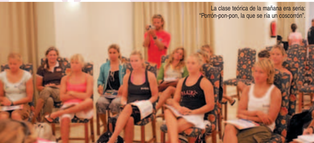
La clase teórica de la mañana era seria: "Porrón-pon-pon, la que se ría un coscorrón".