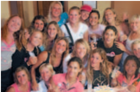
¿Una copa, nenas?