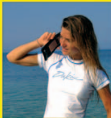
Marcar, Hablar, Escuchar